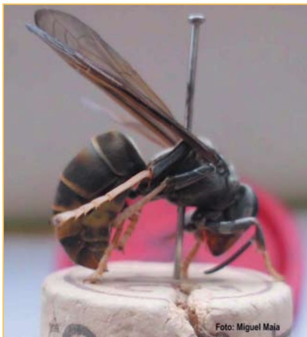
Figura 1 (A). Vespa velutina

A Vespa velutina pertence à classe Hymenoptera, tal como as abelhas. A sua organização social é constituída por uma rainha, várias obreiras, machos e fundadoras. A velutina é caracterizada por possuir um abdómen preto com 2 finas listas amarelas. As patas são amarelas na sua extremidade (Figura 1 A-B).