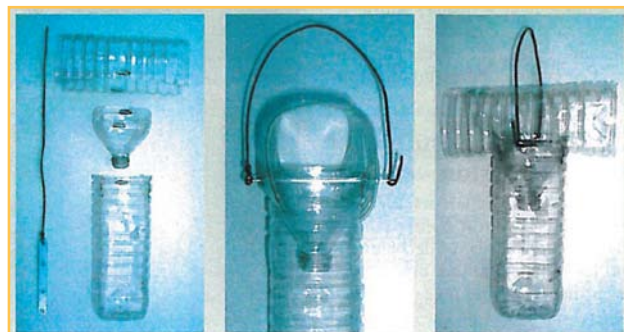
Figura 4. Exemplo do fabrico de uma armadilha

Geralmente, as armadilhas são feitas com garrafas de plástico. As garrafas podem ser de 1,5 lt ou de 5 lt. A figura 4 ilustra o fabrico de uma armadilha. É importante a colocação de um “chapéu” na parte superior da armadilha para evitar a entrada da água da chuva, evitando a diluição do isco.