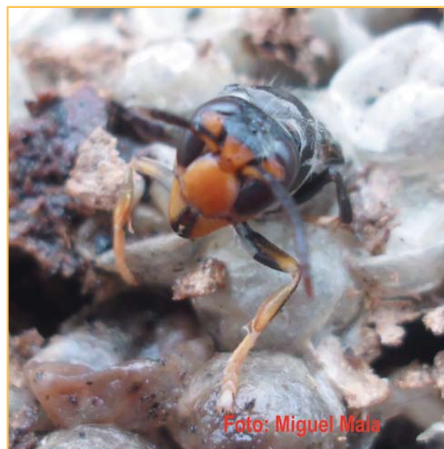
Figura 1 (B). Vespa velutina

Até agora, a maior parte dos ninhos estão localizados em Viana do Castelo (24 ninhos) mas já foram localizados ninhos em outros concelhos: Barcelos (3 ninhos a norte do concelho); Caminha (2 ninhos), Ponte de Lima (1 ninho a sul do concelho) e Vila Verde (5 ninhos) (Figura 2).