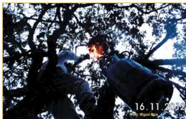
Figura 8. Destruição pelo fogo

Sendo a opção de destruição pela utilização de maçaricos, esta deve ser rápida. Porém, só é possível quando os ninhos estão a baixa altura, por exemplo quando os ninhos são construídos em oliveiras ou árvores de fruto. Nesta situação é necessário ter cuidado com a aproximação do ninho porque as vespas injetam veneno para a face do indivíduo, o que pode ser bastante incomodativo. Tanto na destruição por armas ou maçaricos é sempre aconselhável a colocação de armadilhas num raio de 500 metros do ninho para captura de possíveis fundadoras.