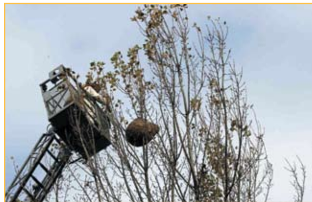
Figura 7. Destruição de ninho em Laje-Vila Verde

A destruição do ninho deve ser ao fim da tarde para capturar o máximo de vespas no seu interior. É aconselhado a que os ninhos secundários não sejam destruídos com armas de fogo entre setembro e a primeira quinzena de novembro. Nesta época do ano existe um número significativo de fundadoras que podem difundir-se mais rapidamente caso o ninho seja deficientemente destruído. Para mais, se a rainha não morrer as vespas reconstróem o ninho, mas no caso a rainha morrer, as vespas também têm a capacidade da sua reconstrução mas só nascerão machos. O ideal seria a destruição do ninho antes de setembro, pois nesta época do ano ainda não existem fundadoras devido à ausência de machos. No entanto, devido à sua difícil localização, devido ainda existirem muitas folhas nas árvores, esta opção não é viável.