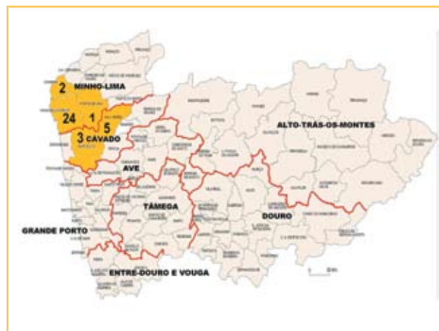
Figura 2. Número de ninhos localizados por concelho.

A velutina tem como habitat natural o sudoeste asiático. Em 2006 a vespa velutina é detetada em França e, pensa-se que o seu aparecimento tenha sido devido a um transporte de bonsais (ou outro material vegetal) com origem na China. Desde essa data até 2012, a vespa velutina foi detetada em 2/3 do território francês. Em 2010, a velutina é detetada no País Basco (Espanha) e em 2011 na Bélgica e em Portugal (GROSSO & SILVA e MAIA, 2012). Possivelmente, a sua entrada no nosso país tenha sido através de transporte de madeiras por via terrestre.