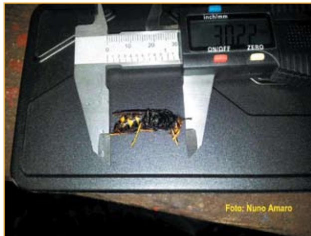
Figura 3. Fundadora capturada em Fevereiro.

As fêmeas fecundadas (futuras rainhas) regressam ao ninho e o macho morre. Em outubro a meados de novembro as futuras rainhas iniciam a hibernação. O local de hibernação pode ser bocados de madeira, no solo, entre muros, entre outros. No início da Primavera, quando a temperatura começa a subir gradualmente, as rainhas saem do estado de hibernação para irem construir os ninhos primários. A figura 3 indica uma fundadora captura em fevereiro em redor de um apiário.