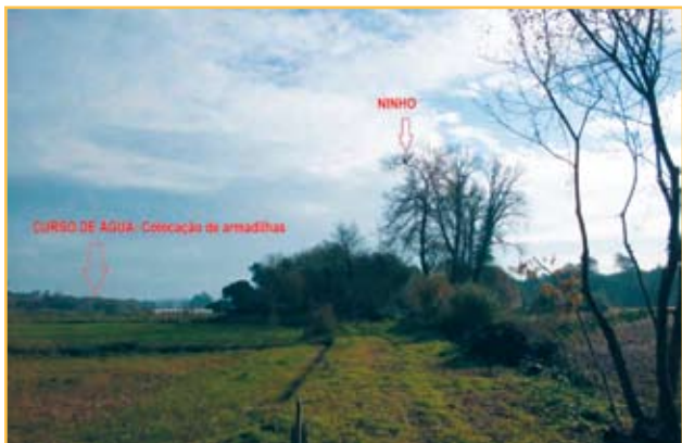
Figura 6. Relação entre ninho secundário e colocação de armadilhas na Fase 2. Local: Chafé/Viana do Castelo

As armadilhas na fase de outono devem ser colocadas em redor dos apiários. De preferência colocar de frente em relação à saída das colmeias. A armadilha deve ser colocada a 1 a 2 metros de distância das colmeias e a \pm 1 metro de altura.