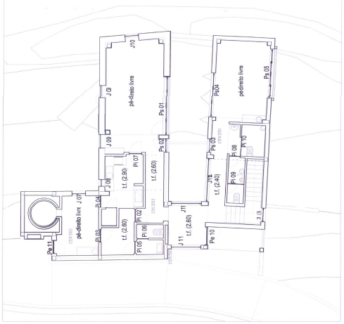
Planta do piso superior - unidades de participação.