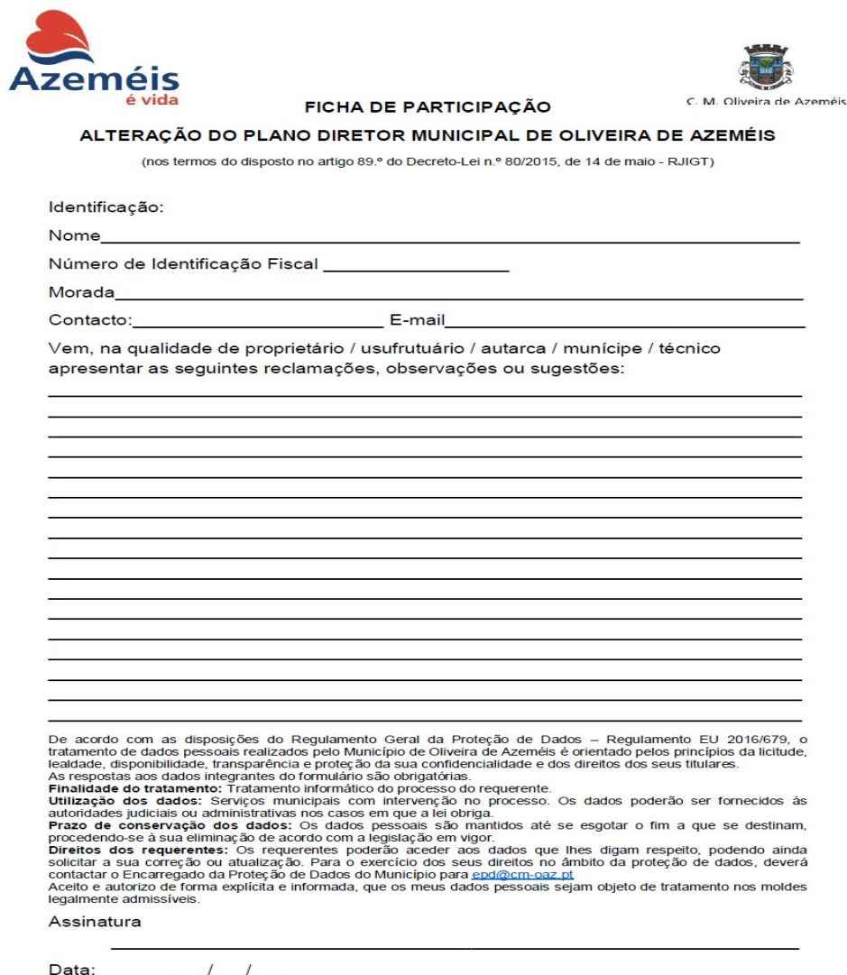
Fig. 6 - Modelo de Participação Pública.

Os interessados tiveram a possibilidade de apresentar as participações por escrito, (sugestões, reclamações, observações e pedidos de esclarecimento) através de correio convencional para a morada Largo da República, 3720 – 240 – Oliveira de Azeméis, do seguinte endereço eletrónico geral@cm-oaz.pt ou procedendo à sua entrega na Loja do Município do Município de Oliveira de Azeméis.