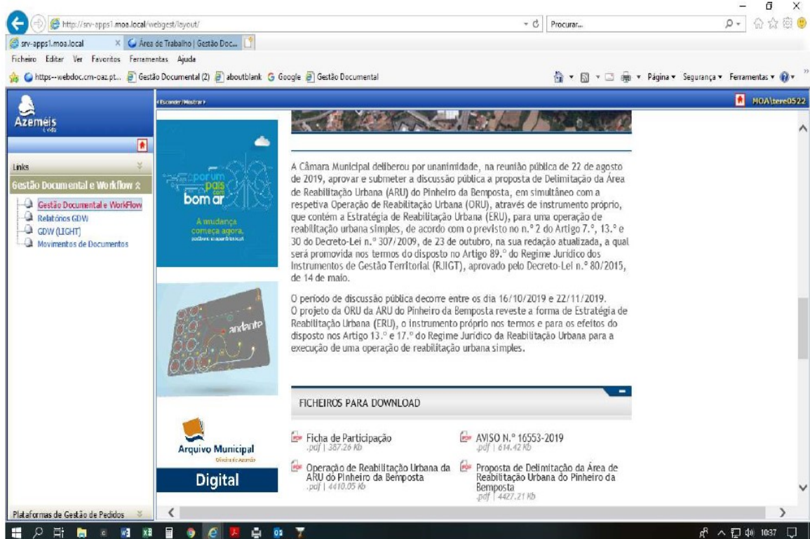
Fig. 4 – Publicação na página institucional da internet do Município.