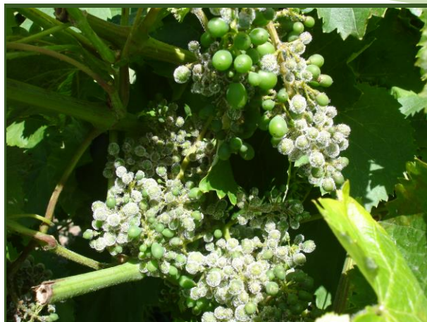
Míldio esporulado ( rot gris ) no cacho

No combate ao míldio em viticultura no Modo de Produção Biológico, são autorizados produtos à base de cobre, cerevisana, óleo de laranja e fosfanatos.