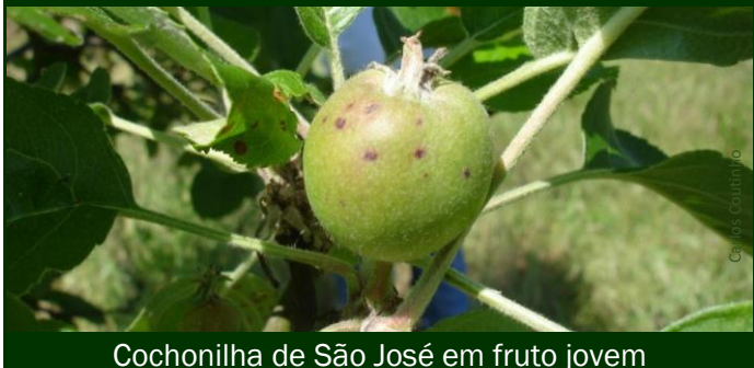
Cochonilha de São José em fruto jovem