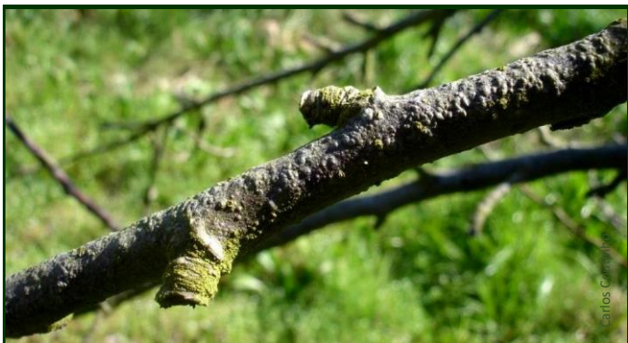
Ramo com cochonilha de S. José (imagem próximo do natural)

Se tem observado a presença e prejuízos causados por esta cochonilha , quer nas árvores, quer diretamente nos frutos, faça agora um tratamento localizado – apenas nas árvores atacadas -, aplicando um inseticida homologado.