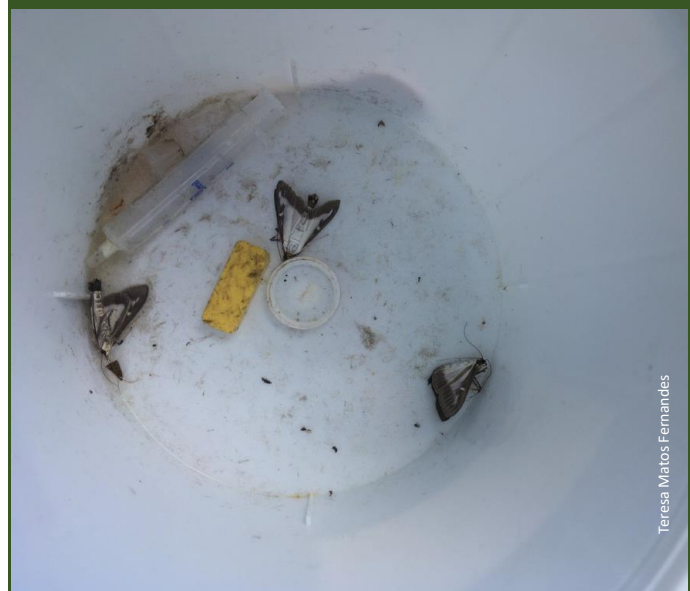
Adultos (borboletas) de traça-do-buxo capturadas na armadilha