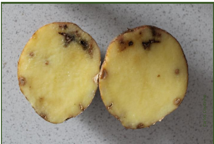
Estragos de traça-da-batata

Esta praga deve ser combatida no campo. Visite regularmente o batatal e aplique um inseticida se constatar a presença da traça da batata.