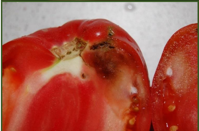
Aspetos dos estragos causados pela Tuta