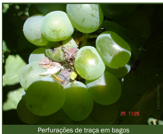
Perfurações de traça em bagos

Para um controlo efetivo da traça-da-uva, é necessário proceder à estimativa do risco, sobretudo à medida que as capturas de traças vão aumentando. Deve ter em conta a casta, o tamanho e a compacidade dos cachos (Quadro 2).