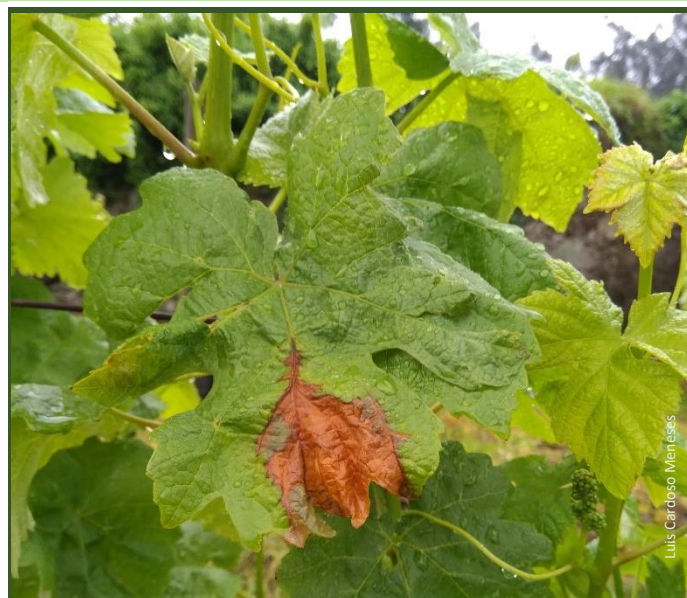
Mancha de Botrytis na folha

Por outro lado, os fungicidas à base de cobre têm efeitos secundários, mas importantes, no controlo da podridão cinzenta.